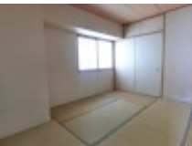
南西の角部屋 和室にも窓がございます