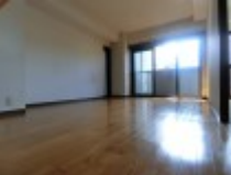
南向きですので陽当り・通風良好です