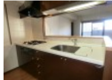
リビングと会話をしながらお料理ができる対面式キッチン