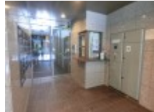
安心のオートロック

■4駅4沿線利用可 地下鉄東西線「京都市役所前」駅 徒歩5分 地下鉄烏丸線「烏丸御池」駅 徒歩8分 京阪本線「三条」駅 徒歩8分 阪: