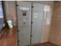
宅配ボックス ネット購入には欠かせません