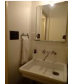
☆TOTO製の試験用洗面台