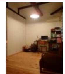
3階6帖の洋室は天井高約3m♪ 大きな梁があり ログハウス風のお部屋です♪