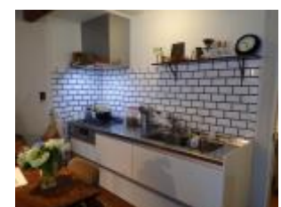
☆キッチン壁はメトロタイル インダストリアルな雰囲気です♪