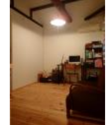
3階6帖の洋室は天井高約3m♪ 大きな梁があり ログハウス風のお部屋です♪