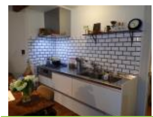
☆キッチン壁はメトロタイル インダストリアルな雰囲気です♪