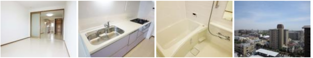
LDK キッチン 浴室 住戸からの眺望

※ご都合の悪い方は別の日でもご内覧いただけます。フリーダイヤルにて山西までお問い合わせください。