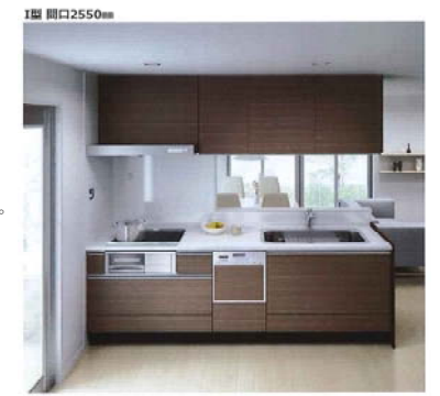
キッチン LIXIL Arise ※こちらの写真はイメージ写真で実際の仕様とは異なります。