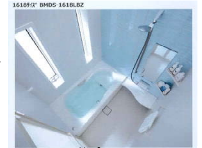
浴室 タカラスタンダード OFELIA ※こちらの写真はイメージ写真で実際の仕様とは異なります。