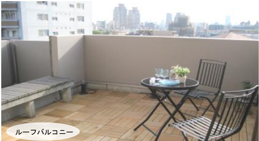
ルーフバルコニー