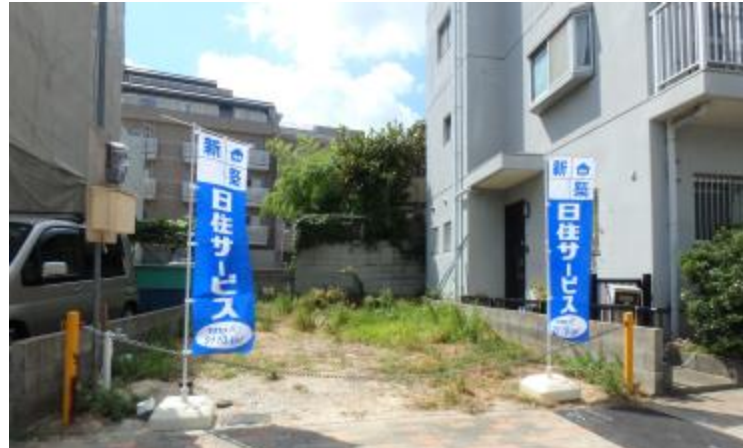
「前面道路は公道で、幅員は約1.8m有り、車の出し入れもし易いです。」