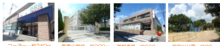
コーヨー...約240m 西灘小学校...約320m 灘郵便局...約660m 都賀川公園...約20m