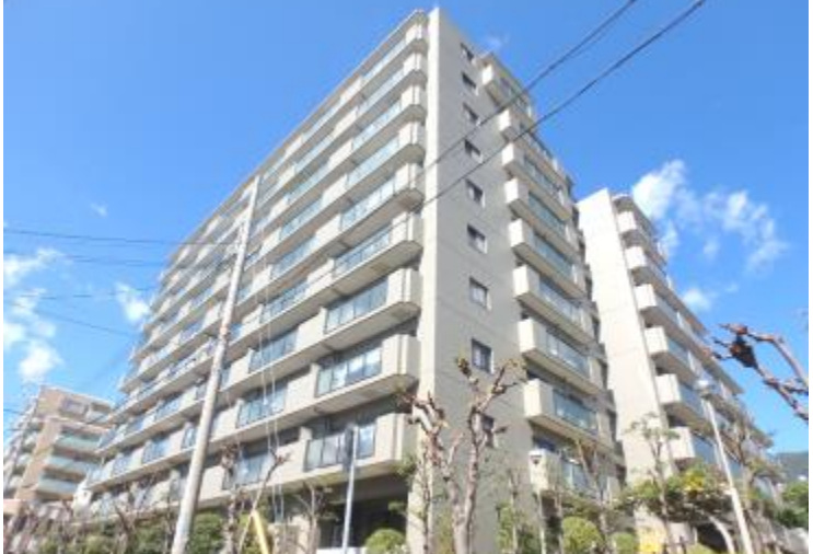
「光と風が注ぎ込む南西角部屋です。是非現地でご覧ください。」