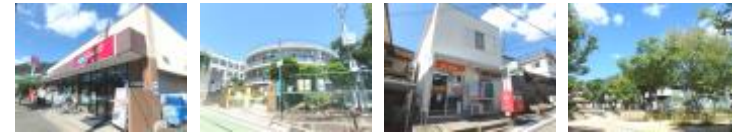
コブ...約420m 美野丘小学校...約530m 国玉郵便局...約620m 篠原公園...約480m