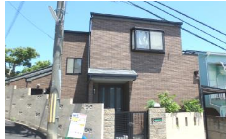
「現在空き家の為、お部屋の隅々までゆっくりとご覧頂けます。」