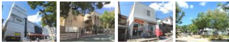
グルメシティ...約370m 摩耶小学校...約580m 国玉郵便局...約450m 篠原公園...約60m