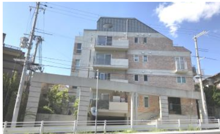
「六甲山麓の自然を身近に感じながら生活できる、安らぎの住環境です。」