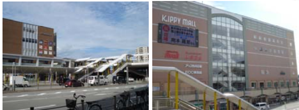
(JR三田駅徒歩9分) (キッピーモールまで約640m)

JR三田駅徒歩9分の住宅用地 駅までほぼ平坦で行けます 建築条件無し 好きなメーカーで建築可 更地渡しです (プラン図作成出来ます)