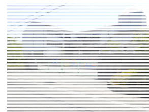
(つつじが丘小学校)